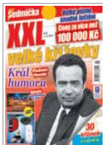
1/1 do zrcadla 205×273 mm na spad 230×303 mm