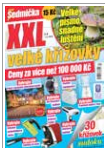
1/1 do zrcadla 205×273 mm na spad 230×303 mm