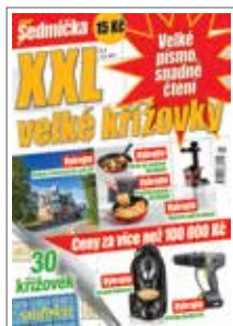
1/1 do zrcadla 205×273 mm na spad 230×303 mm