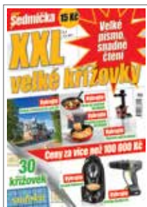
1/1 do zrcadla 205×273 mm na spad 230×303 mm