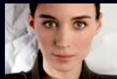
ROONEY MARA, herečka

STO STRAN ROZHOVORŮ PRO LIDI, KTEŘÍ NEZAPOMNĚLI ČÍST