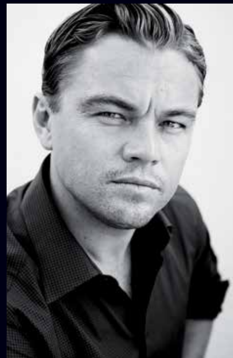
LEONARDO DICAPRIO, herec